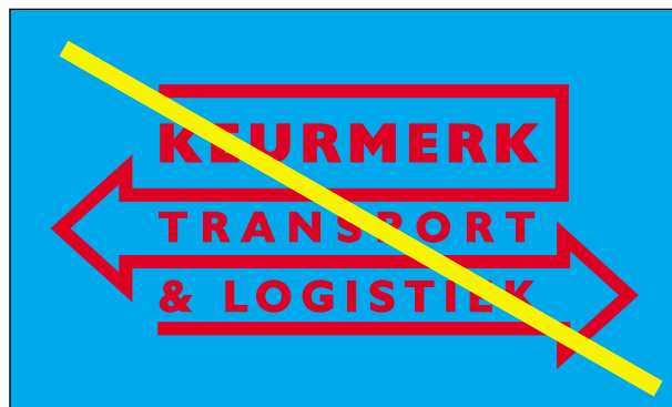
Voorbeeld 1b kleurenlogo op gekleurde achtergrond: FOUT!