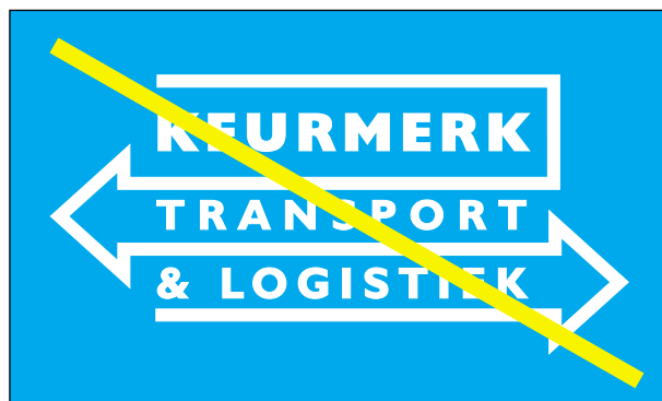
Voorbeeld 2b diaplogo op gekleurde achtergrond: FOUT!